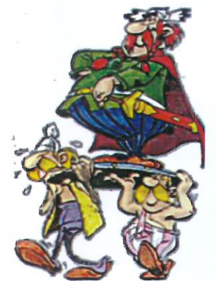
Le chef du quartier